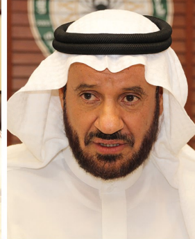
معالي الاستاذ عبدالله بن داوود الفايز