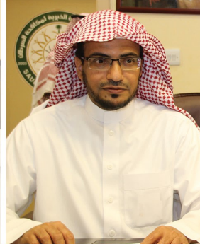
فضيلة الشيخ صالح بن عواد المغامسي