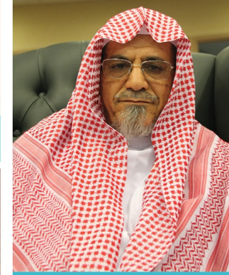
معالي الدكتور صالح بن عبدالله بن حميد